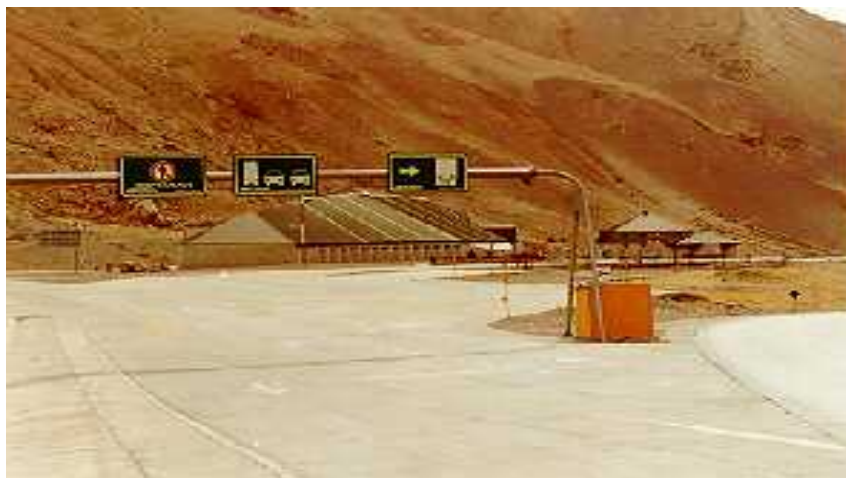
Vista parcial complejo Los Horcones - Argentina