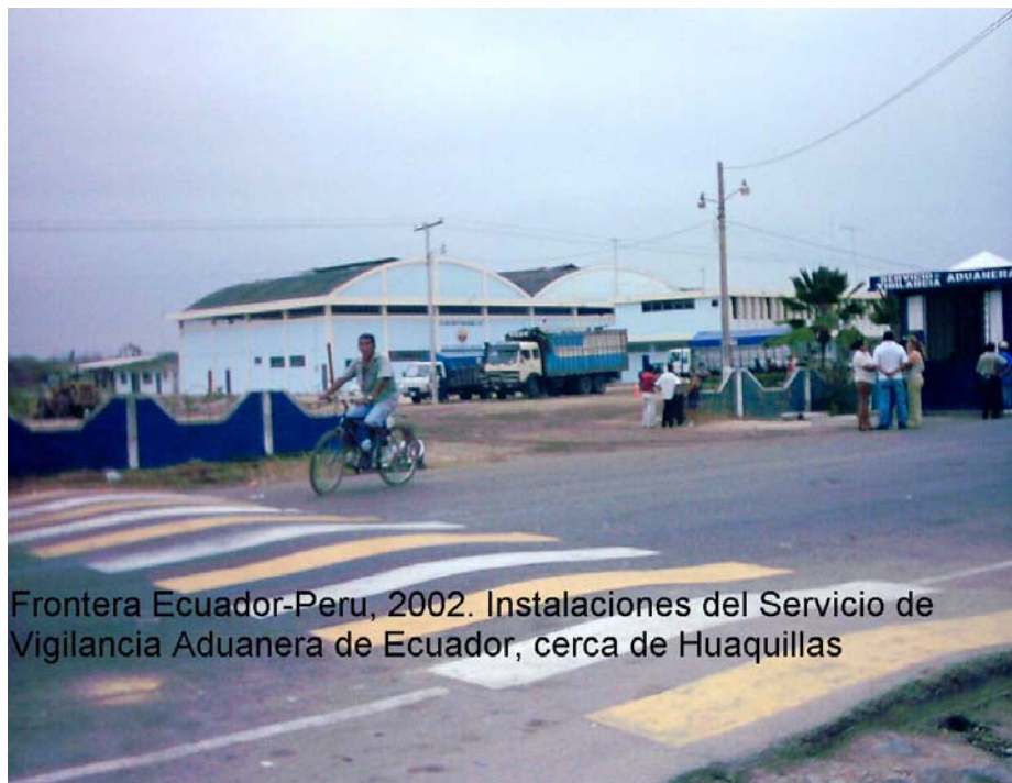
Frontera Ecuador-Peru, 2002. Instalaciones del Servicio de Vigilancia Aduanera de Ecuador, cerca de Huaquillas