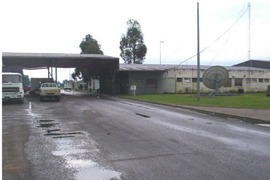
Recinto aduanero Argentino