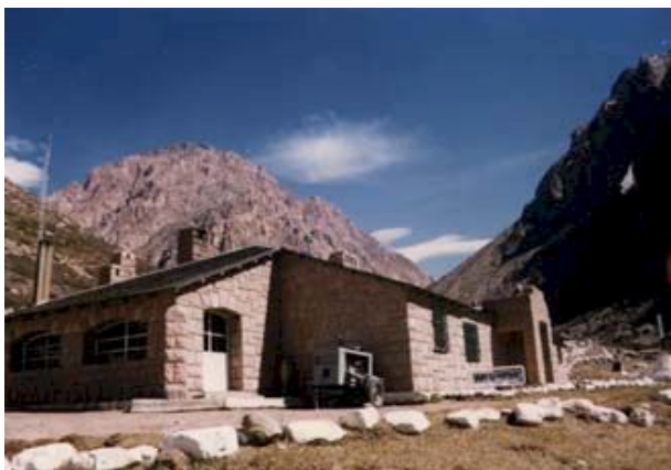
Portillo de piuquenes – Instalaciones Argentinas