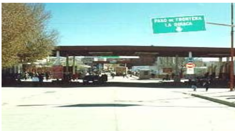
Vista del paso La Quiaca – Villazón