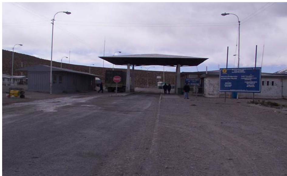
Frontera lado boliviano – área de control de pasajeros