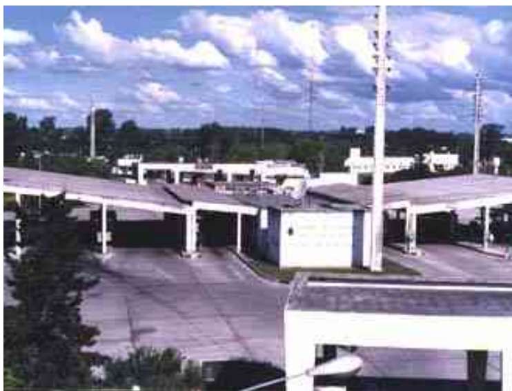
Área de Control integrado Colón – Paysandú