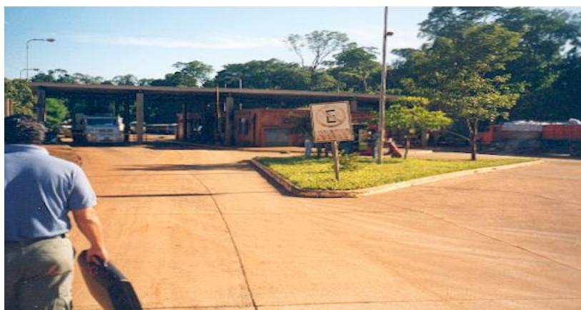
Vista parcial del recinto aduanero argentino