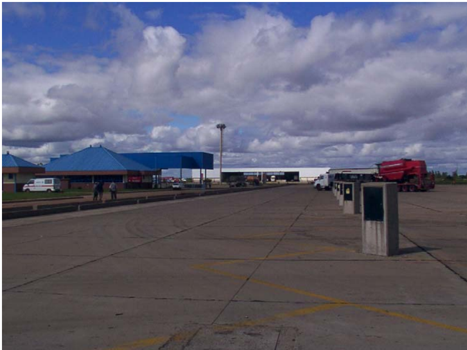
Playa de estacionamiento de camiones