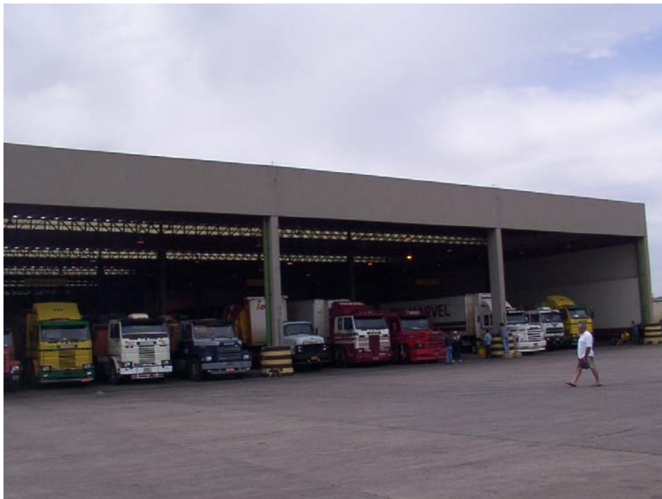
Área de control de importaciones – EADI Uruguayana