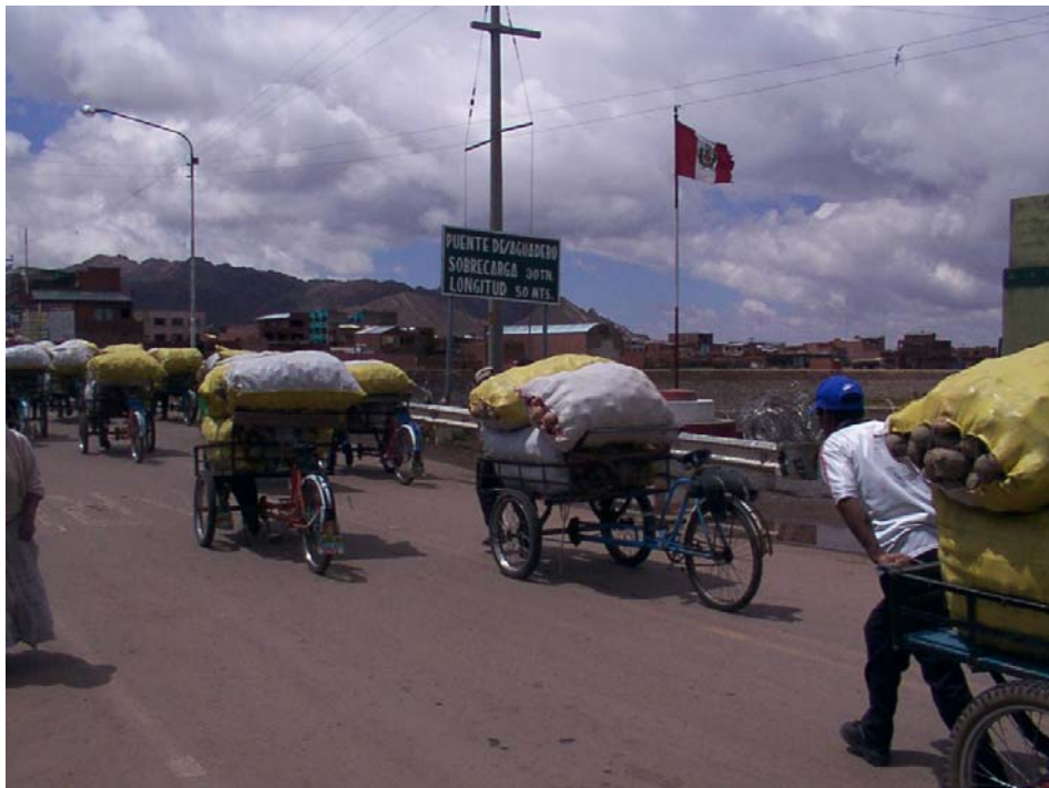
Transporte internacional artesanal