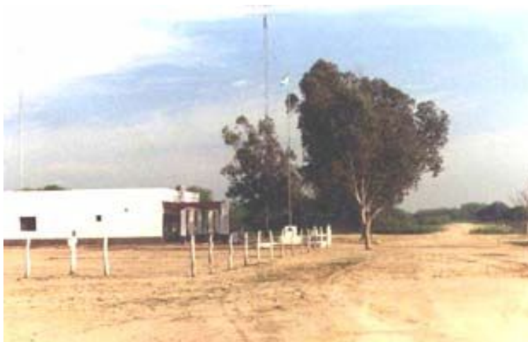
Paso El Remanso – La Verde – Lado Argentino