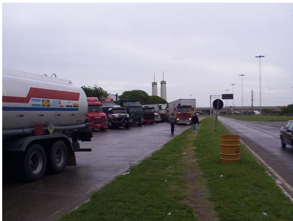
Playa de camiones BR 290