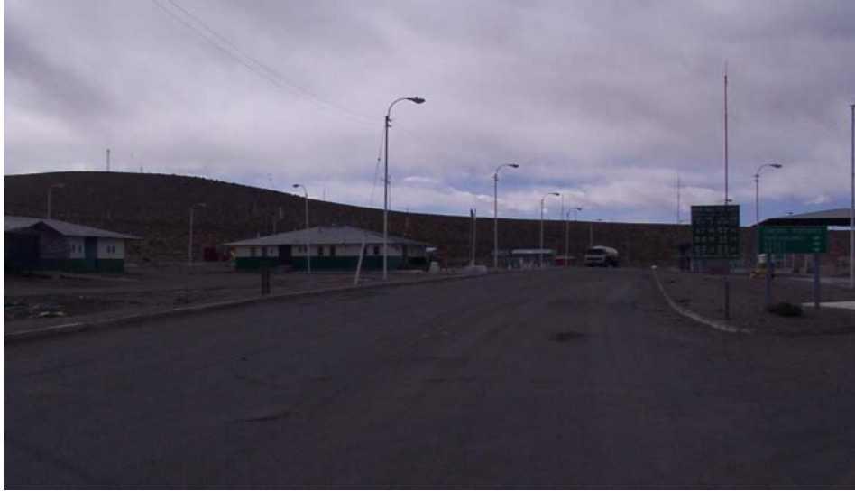
Paso de Frontera - Lado Chileno