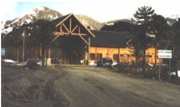
Paso Mumuil Malal – Lado Argentino