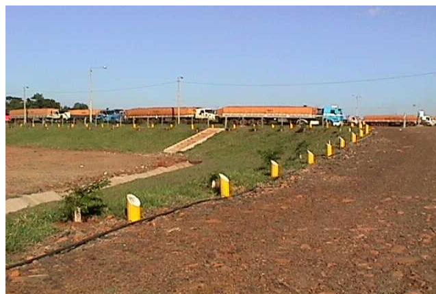
Vista de calle interna y patio de estacionamiento de ALGESA