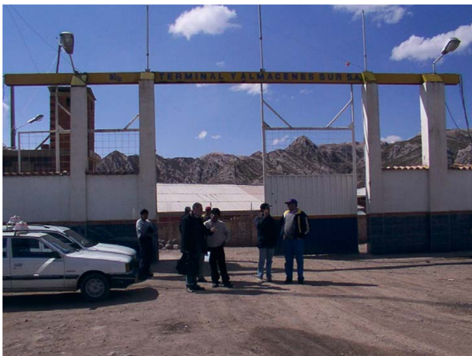
Instalaciones de TASA – Recinto aduanero del Perú concesionado