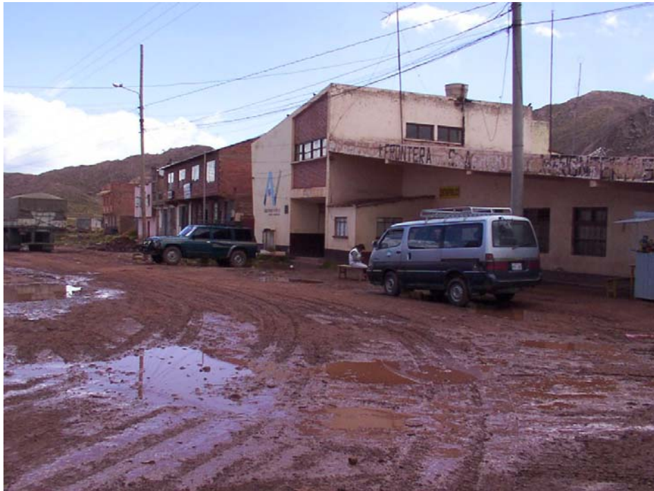
Aduana de Bolivia y red vial utilizada por el tránsito pesado