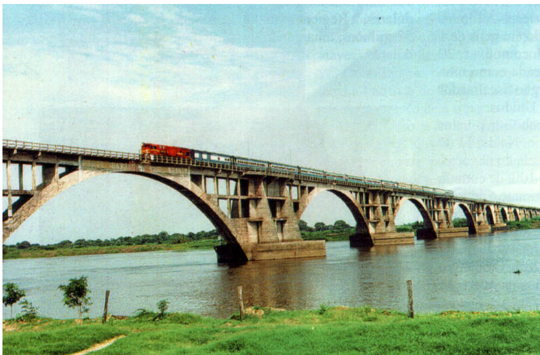
Puente Internacional – Corumbá – Puerto Suárez