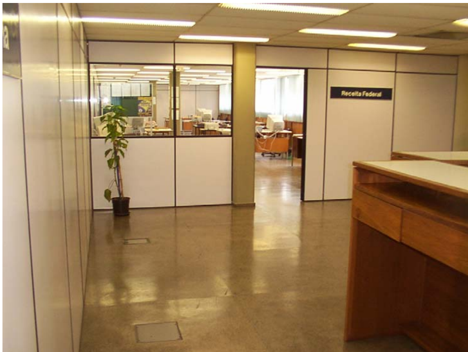
Oficinas de la Aduana Argentina en la EADI – Uruguayana