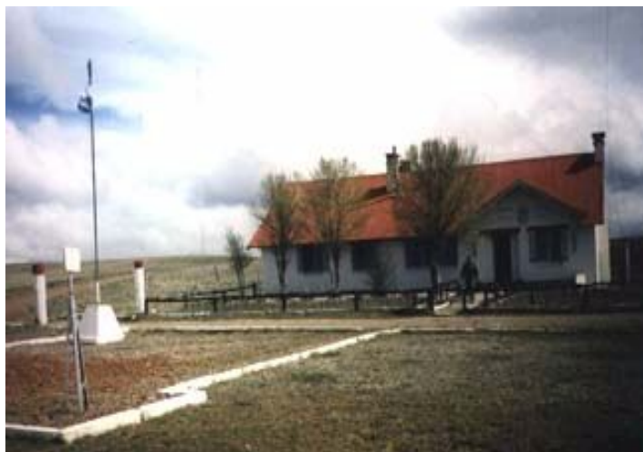
Paso Pampa Alta – Lado Argentino