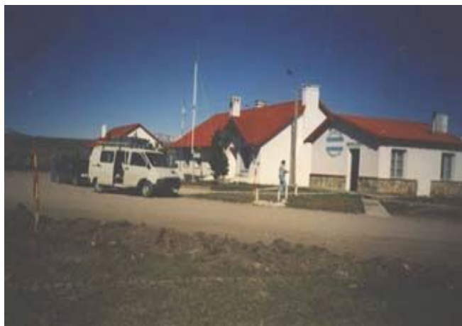
Instalaciones Argentinas en Huemules