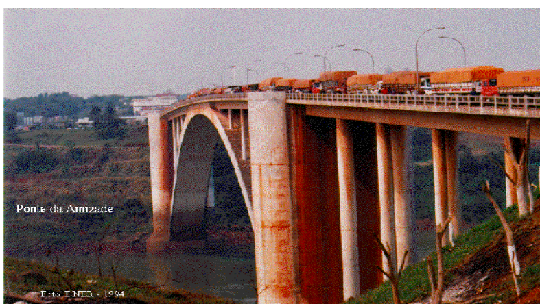
Paso de camiones por el Puente de la Amistad