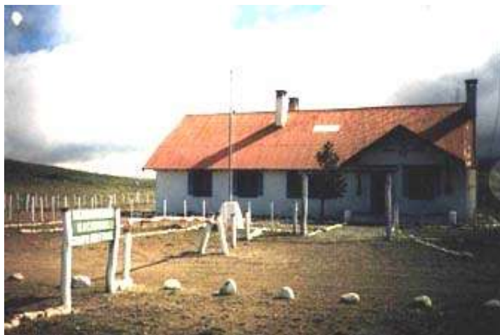
Paso Río Frías – Lado Argentino