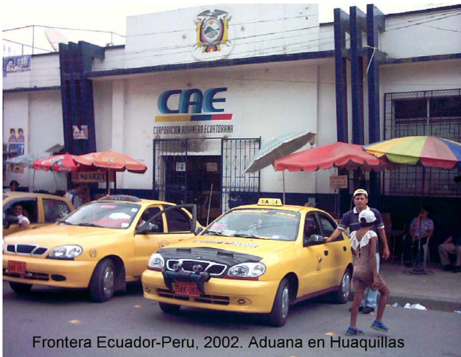
Frontera Ecuador-Peru, 2002. Aduana en Huaquillas