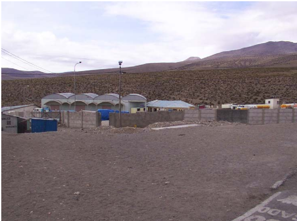
Recinto Aduanero - Lado Boliviano concesionado a Frontera S.A