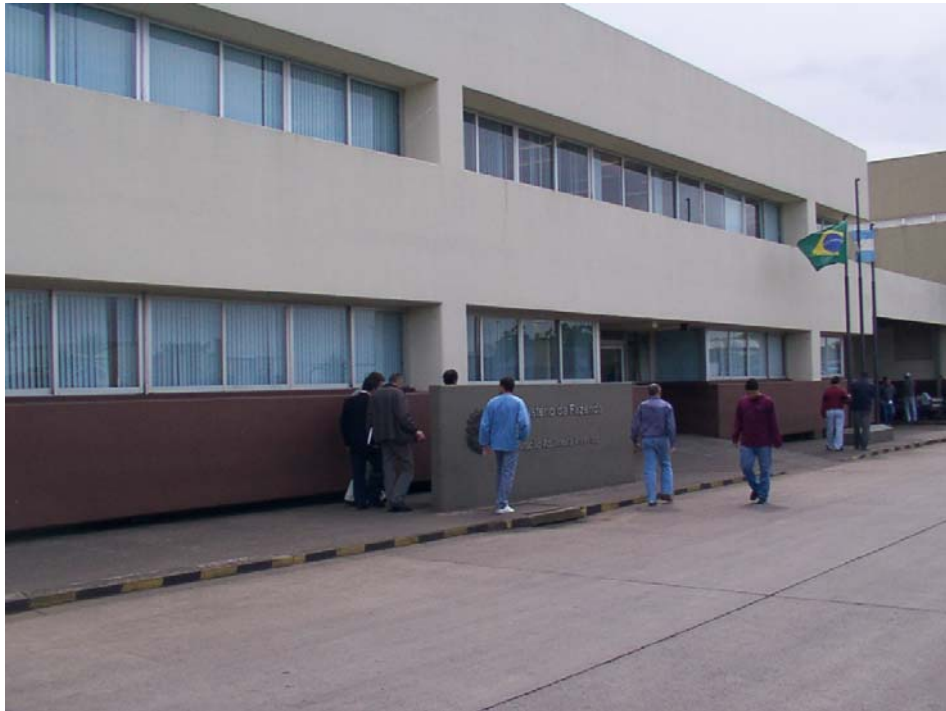
Sector de oficinas – EADI Uruguayana