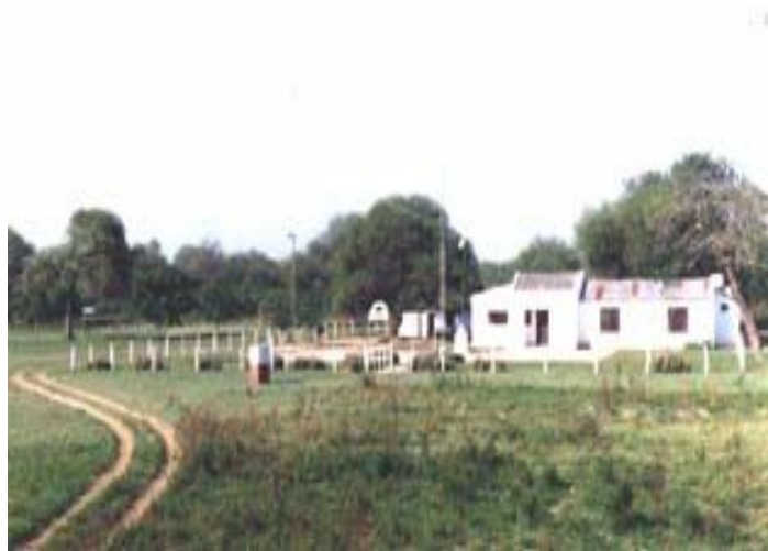
Paso Isleta – Paraje Rojas Silva – Lado Argentino