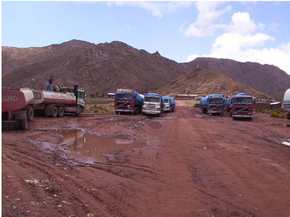
Camiones estacionados en la vía pública en las cercanías de la aduana de Bolivia