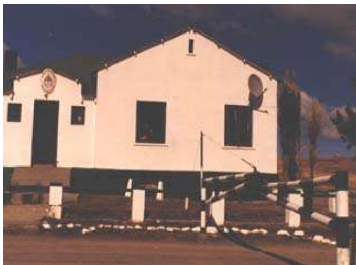
Paso Río Don Guillermo – Lado Argentino