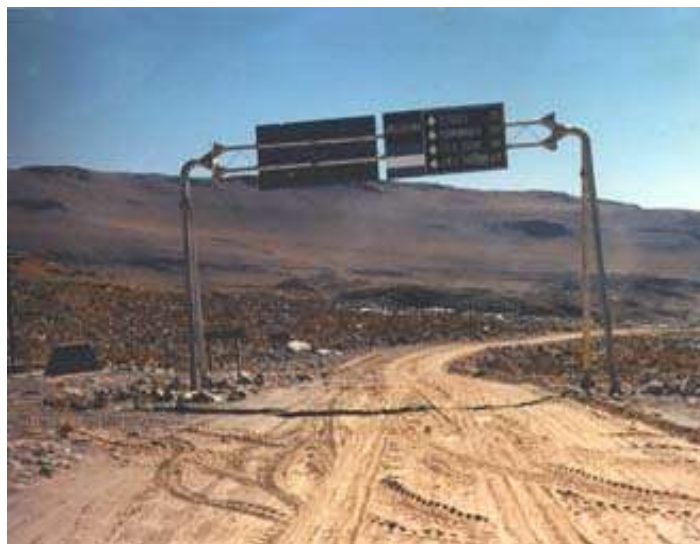
Paso de Jama