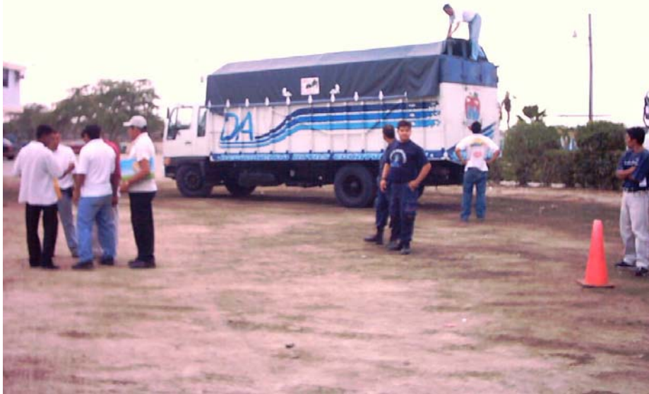
Frontera Ecuador-Peru, 2002. Inspección de camión en instalaciones del SVA de Ecuador