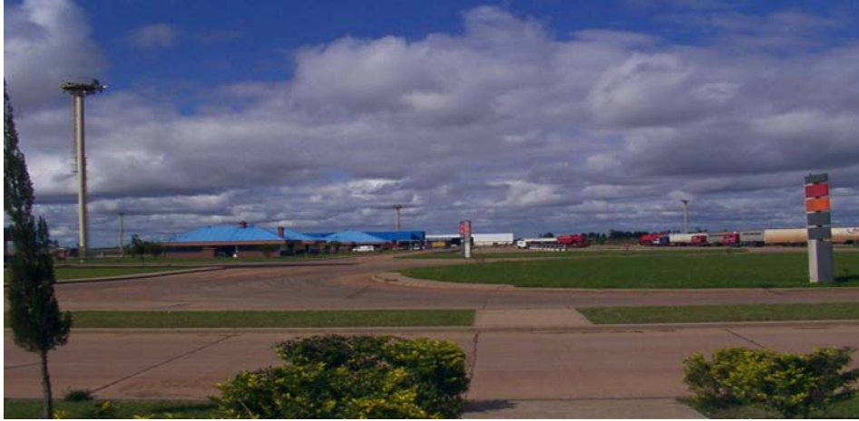
Vista General del Complejo