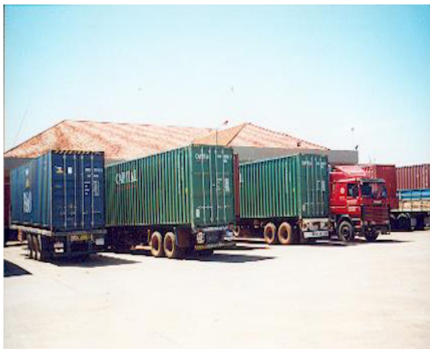
Vista parcial del recinto aduanero integrado – playa y zona de control