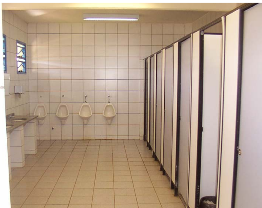
Sanitarios para los transportistas