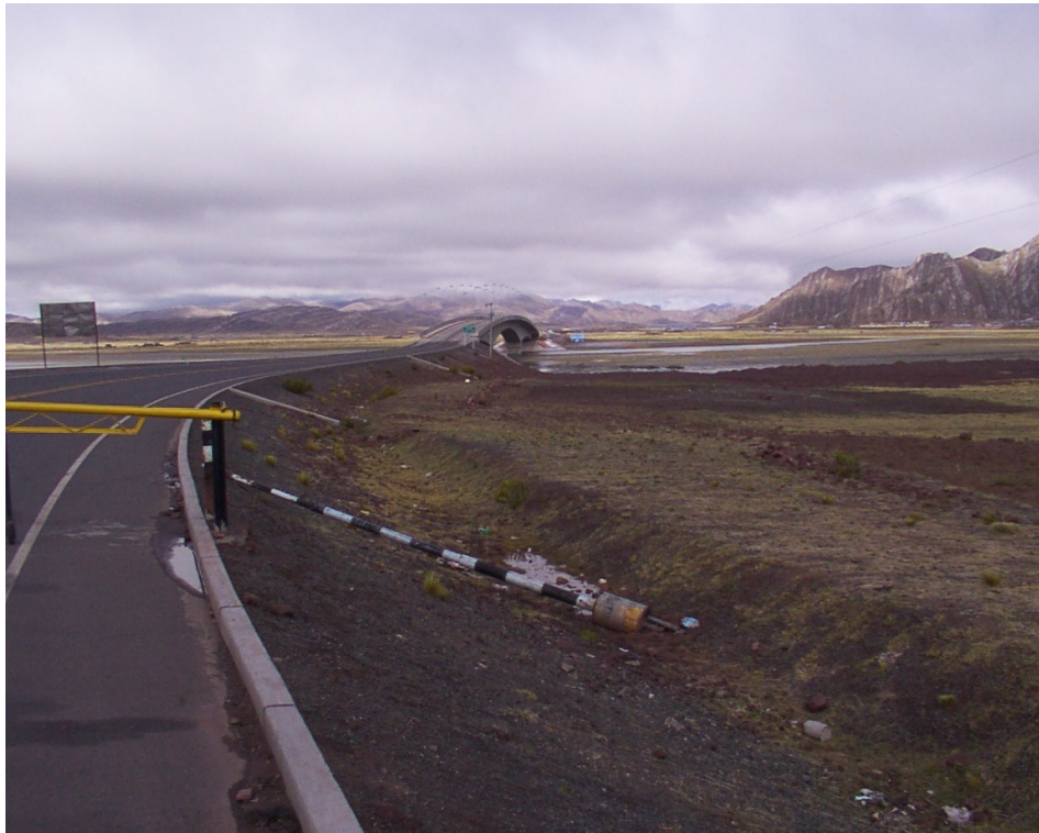
Vista del Puente nuevo recientemente inaugurado