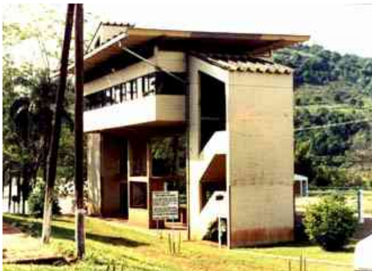
Alba Posse – Puerto Mauá