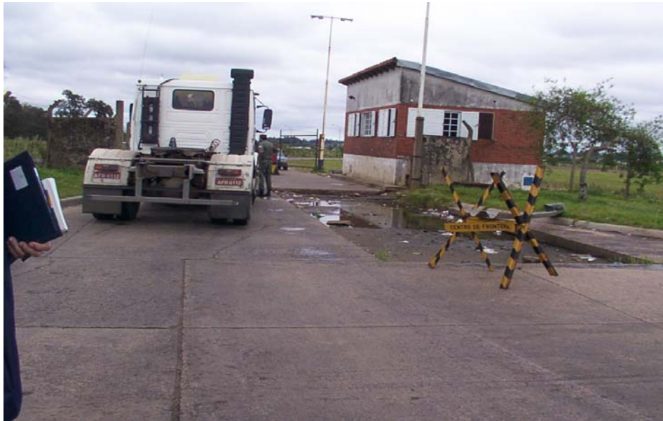
Portón de salida recinto argentino