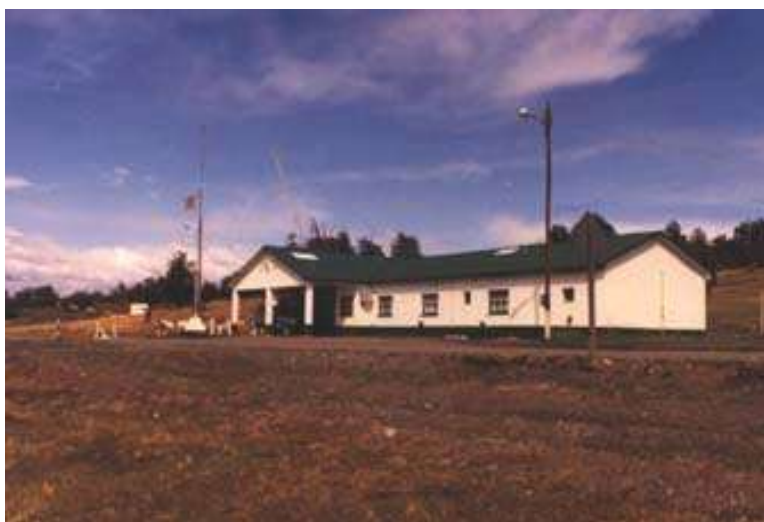
Paso Laurita – Casas Viejas – Lado Argentino