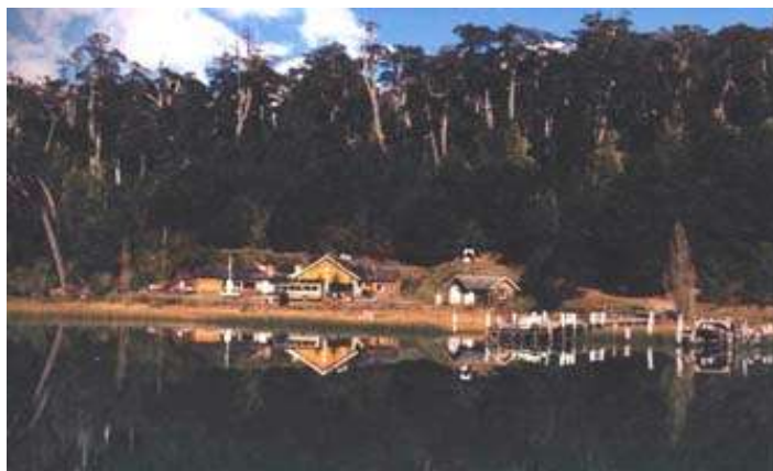
Paso Perez Rosales – Lado Argentino