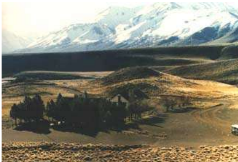
Paso Pichachen – Lado Argentino