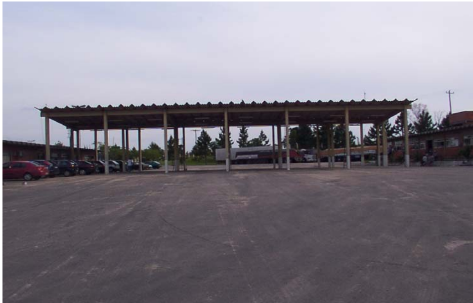
Instalaciones para el control físico de la mercadería en el ACI