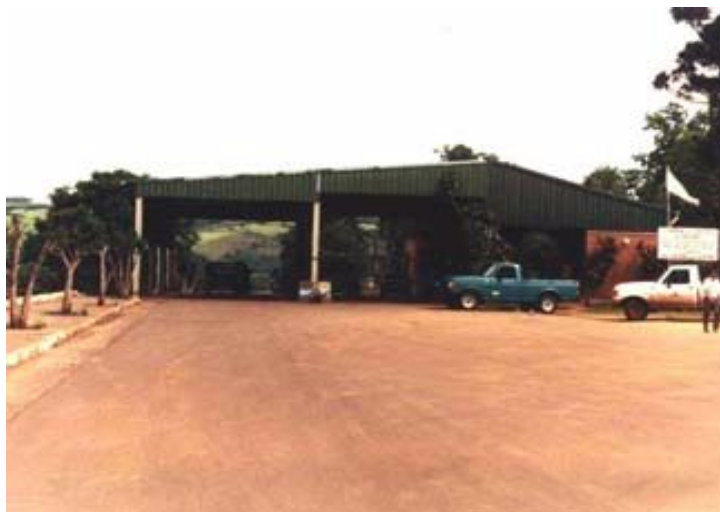
El Soberbio – Porto Soberbo