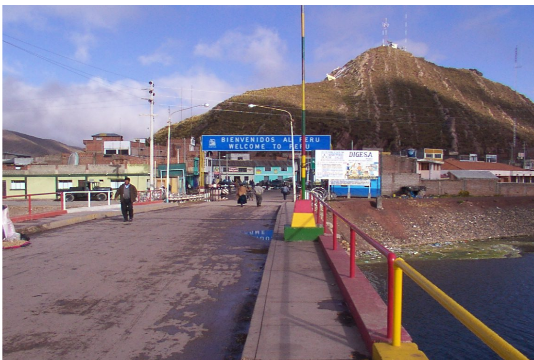
Paso de Desaguadero – Puente Viejo