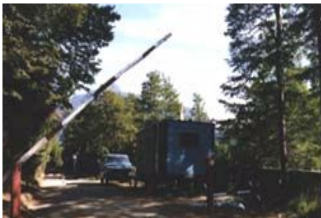
Paso Carirriñe - Argentina