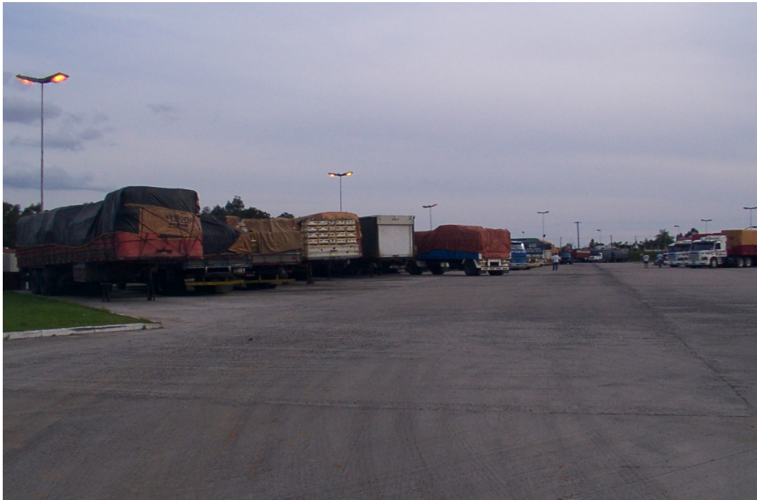
Playa de estacionamiento camiones en el ACI