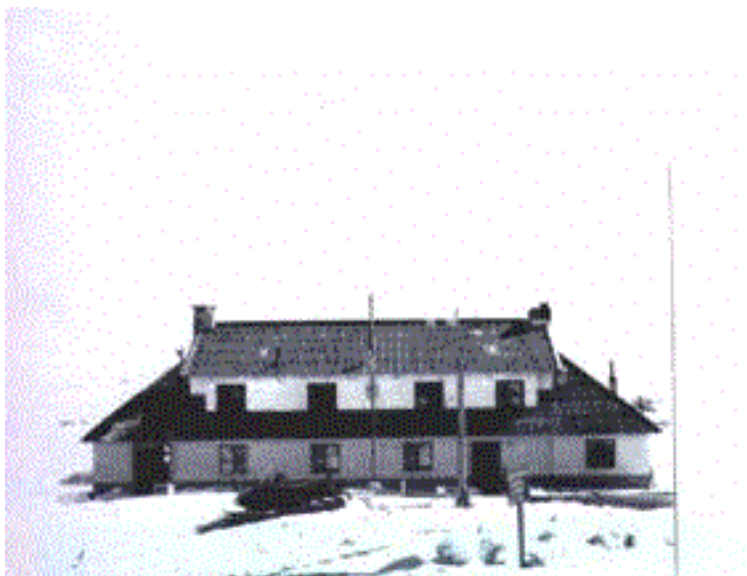
Paso Copahue – Instalaciones Argentinas