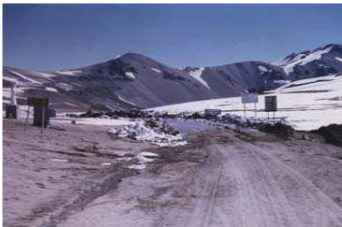
Paso Pehuenche o Maule