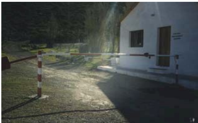
Paso Ingeniero Ibáñez – Pallavicini – Lado Argentino