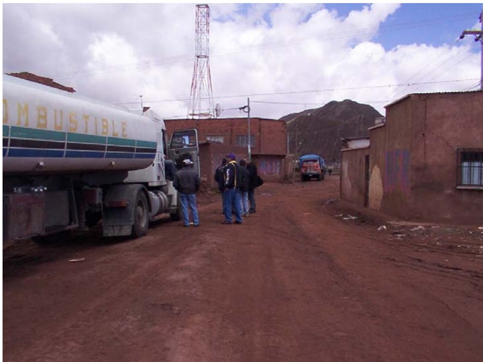
Transporte de sustancias peligrosas estacionado en la red vial urbana