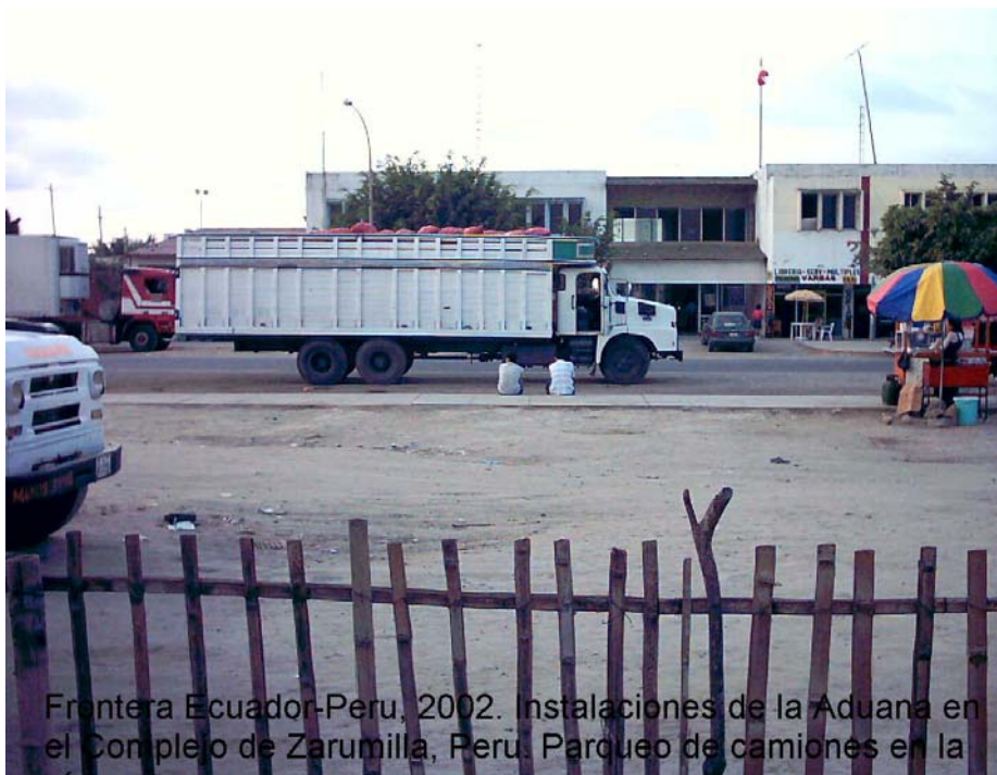
Frontera Ecuador-Peru, 2002. Instalaciones de la Aduana en el Complejo de Zarumilla, Peru. Parque de camiones en la