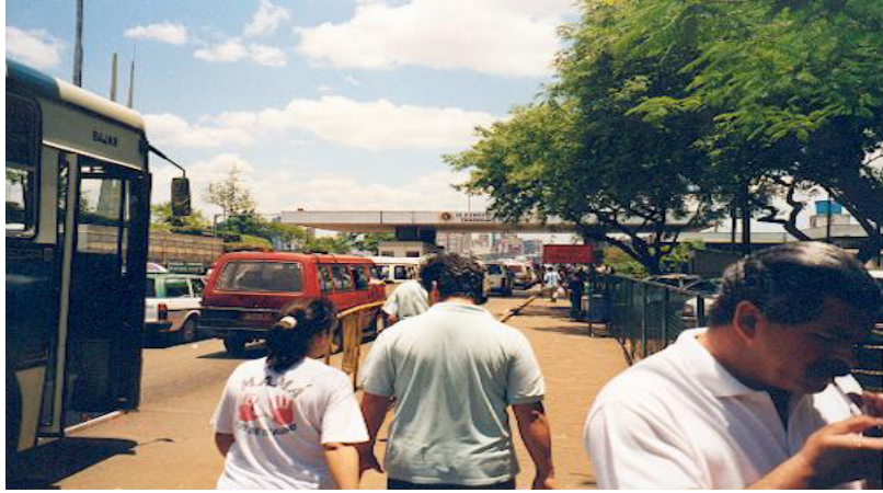
Vista parcial del Puente de la Amistad en horario comercial