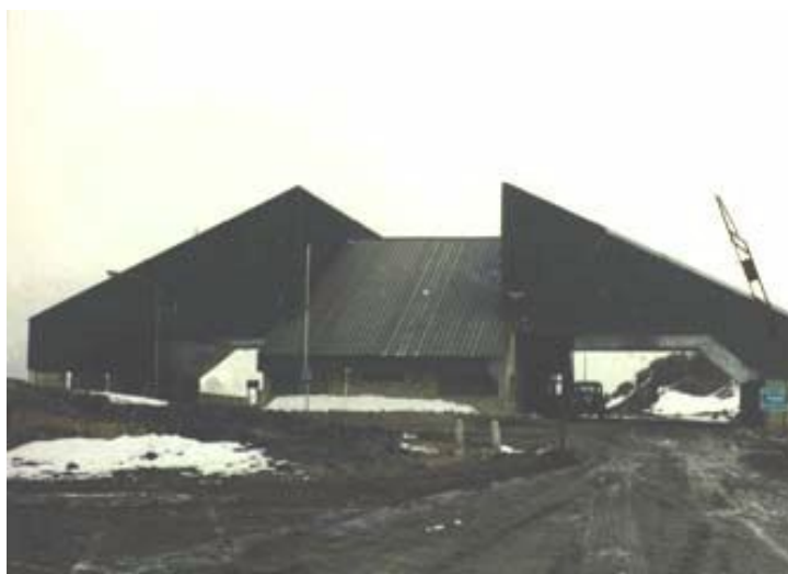
Pino Hachado vista parcial lado Argentino