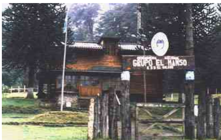
Paso Río Manso - Argentina