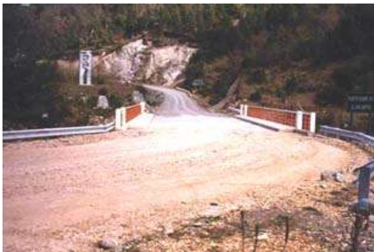
Paso Río Encuentro – Lado Argentino