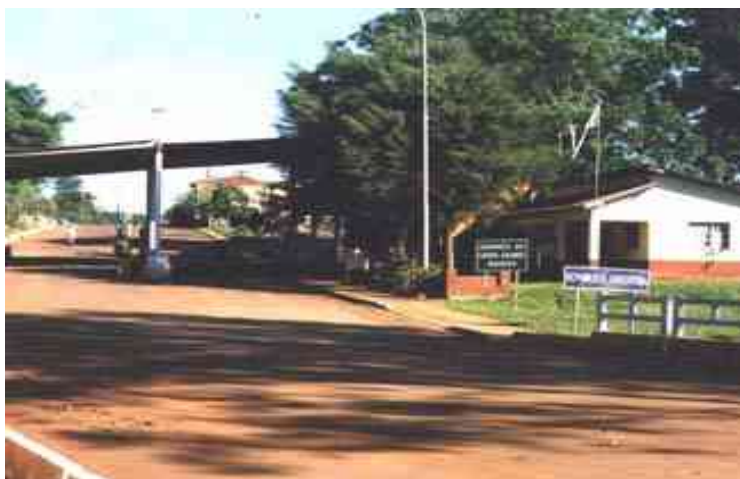
San Antonio – San Antonio