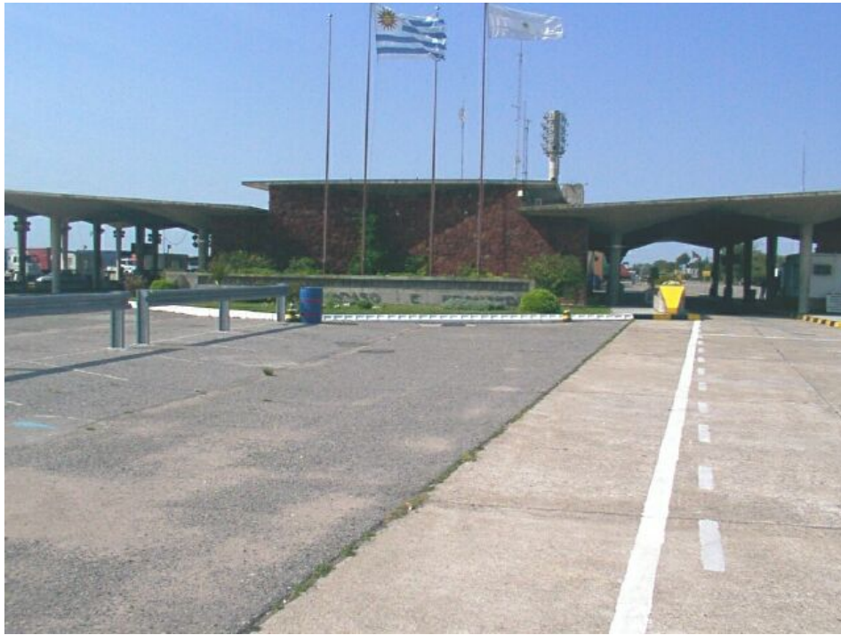
Centro de Frontera – Control de pasajeros