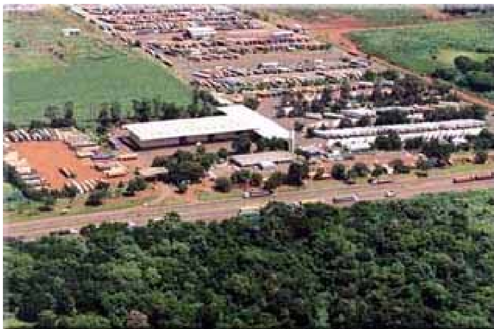
Vista de la EADI FOZ DE IGUAZU