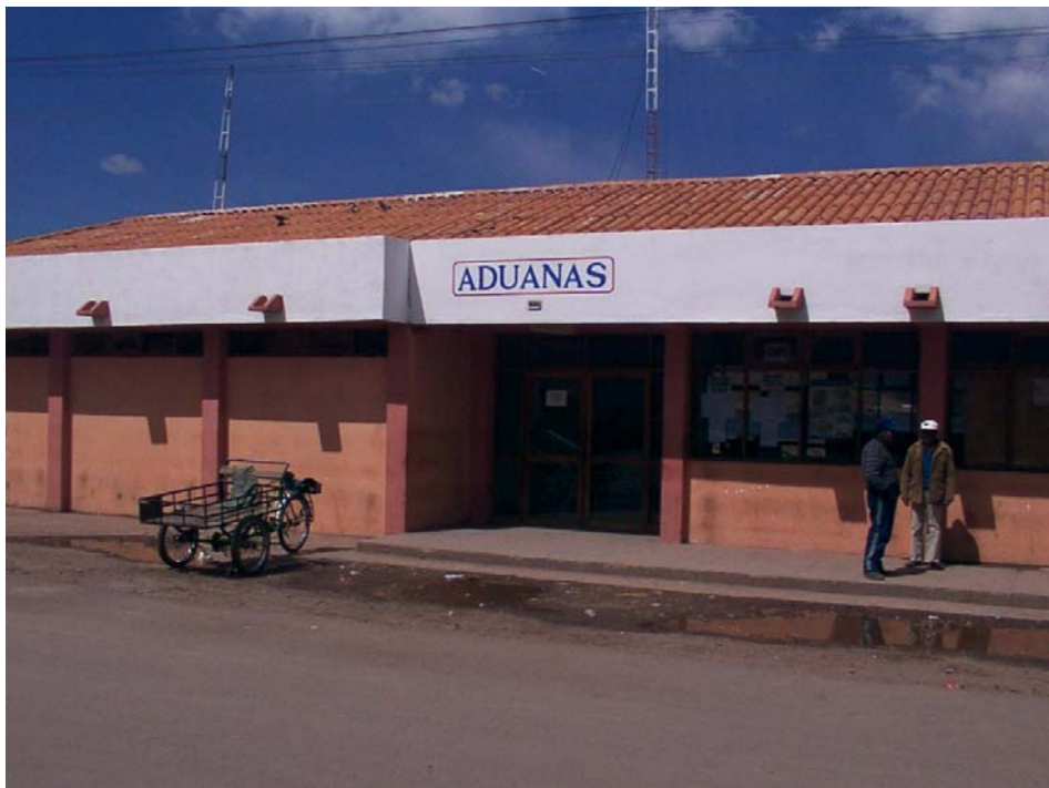
Edificio de la Aduana del Perú