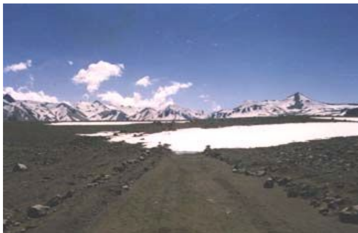
Paso Cajón del Maipo – Acceso lado argentino