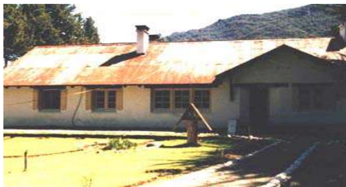
Paso Río Puelo – Instalaciones Argentinas