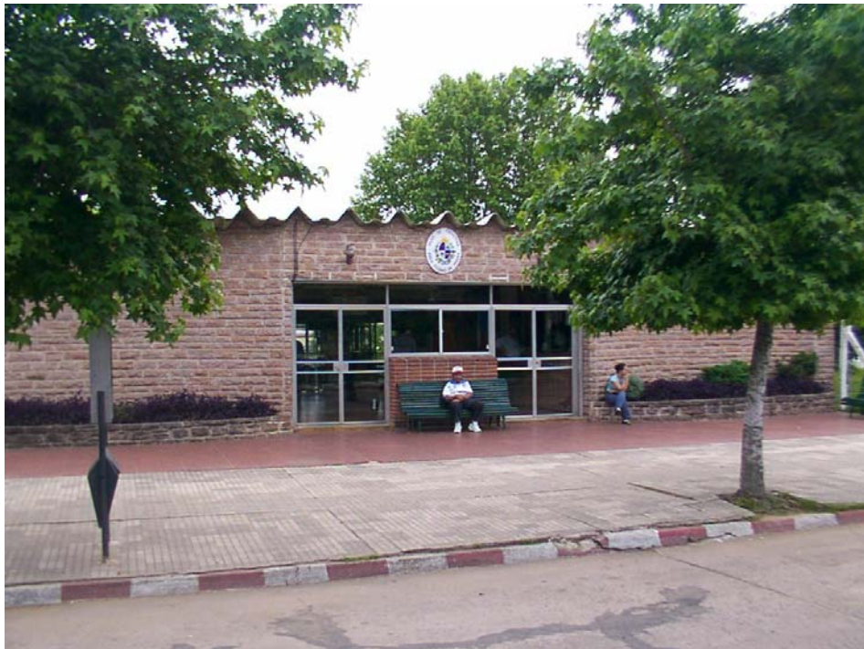
Edificio de control integrado de pasajeros en la ciudad de Rivera