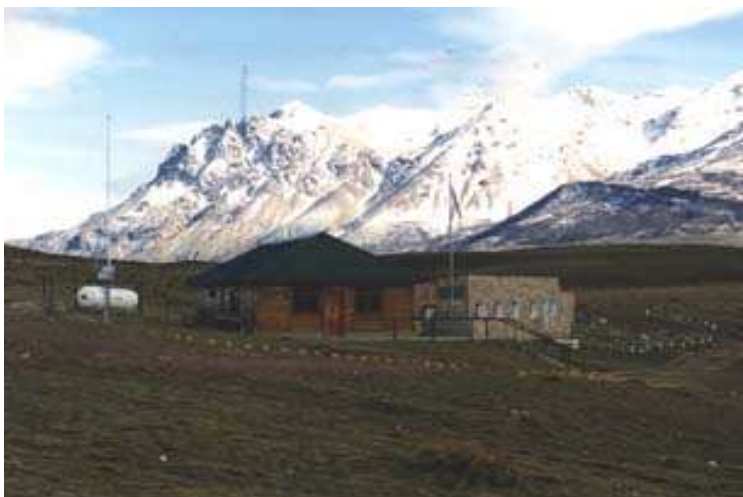
Paso Roballos o Rodolfo – Lado Argentina