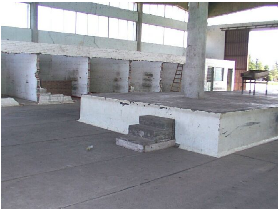
Área de control físico de mercaderías – Uruguay