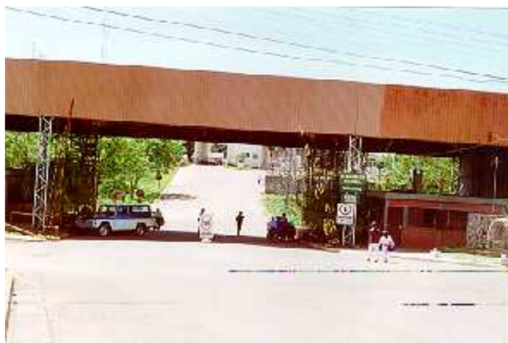
Vista del paso lado argentino