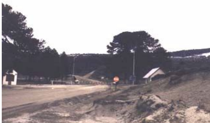
Paso de Icalma