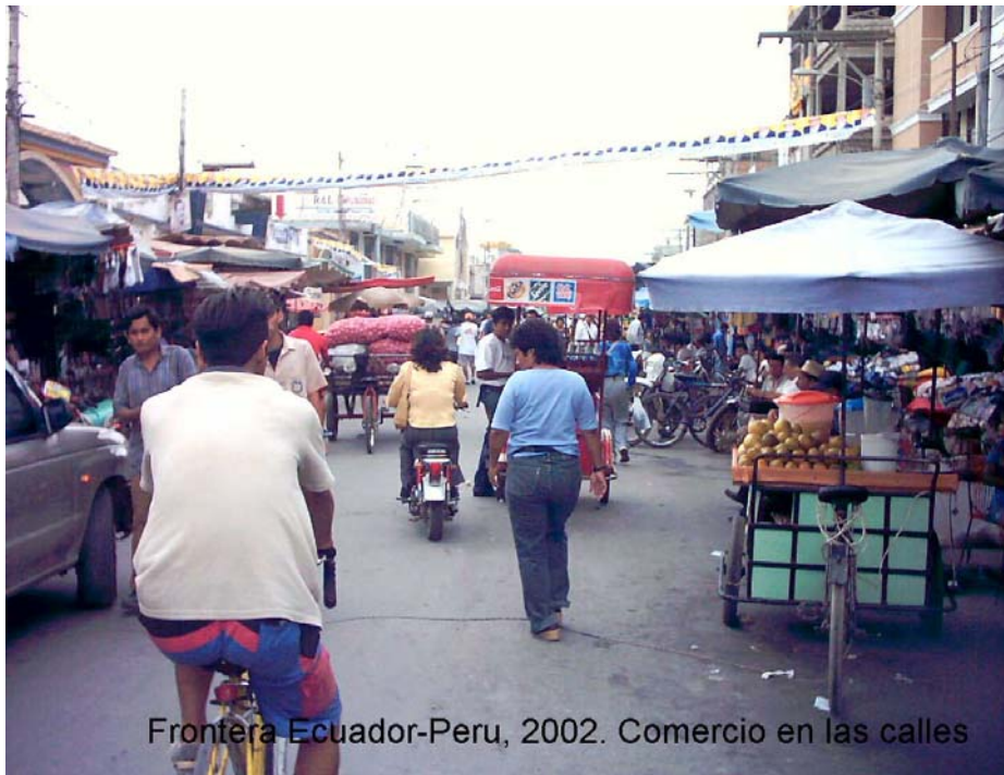
Frontera Ecuador-Peru, 2002. Comercio en las calles