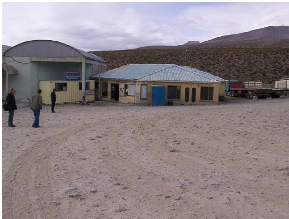
Instalaciones de la Aduana Boliviana en Tambo Quemado