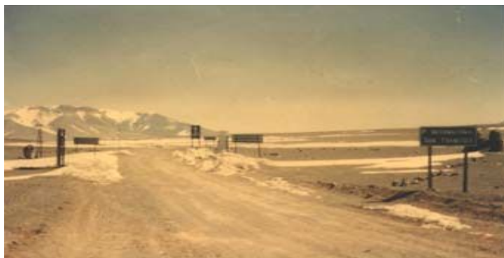
Paso San Francisco – Acceso Argentina