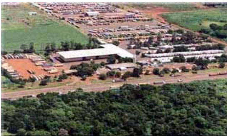
Vista del Recinto aduanero Brasileño de Foz de Iguazú