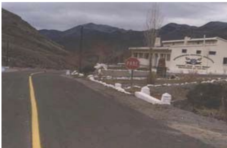
Paso Agua Negra – Acceso Argentina