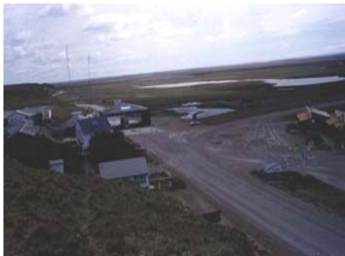
Vista parcial instalaciones argentinas