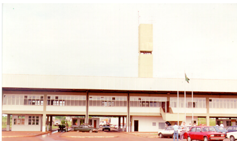
Acceso al puente internacional – Cabecera Argentina Puerto Iguazú