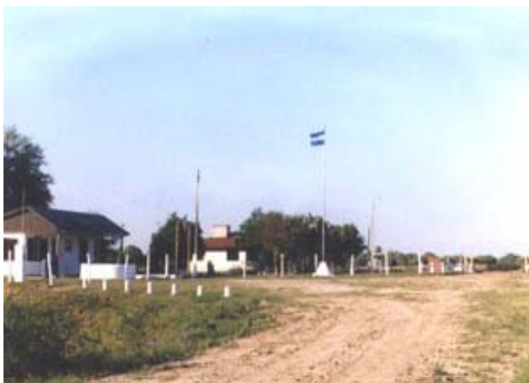
Paso Colonia General Belgrano – General Bruquez