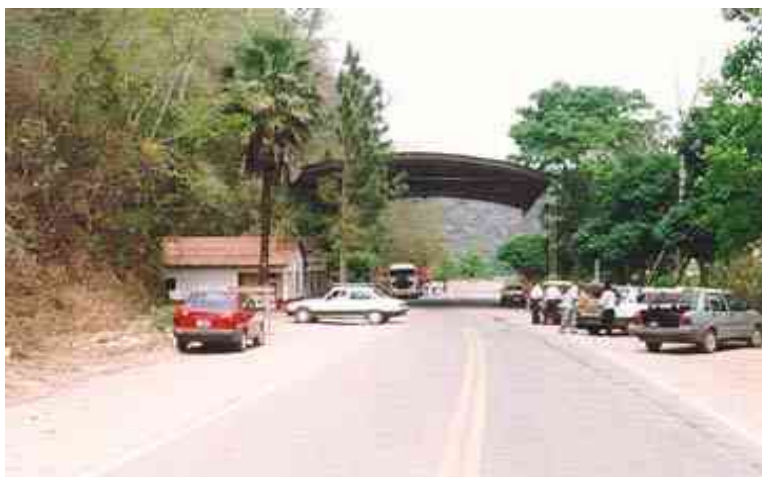
Vista del paso Orán – Bermejo