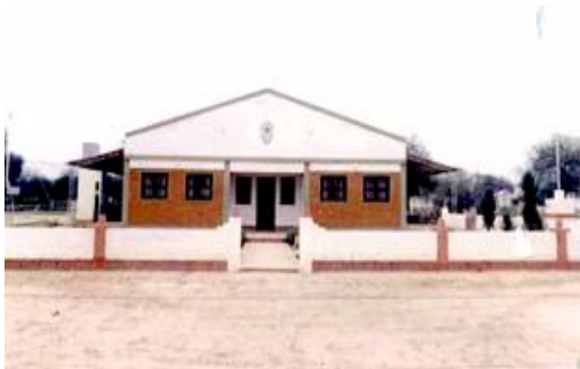
Paso Lamadrid – San Leonardo – Lado Argentina