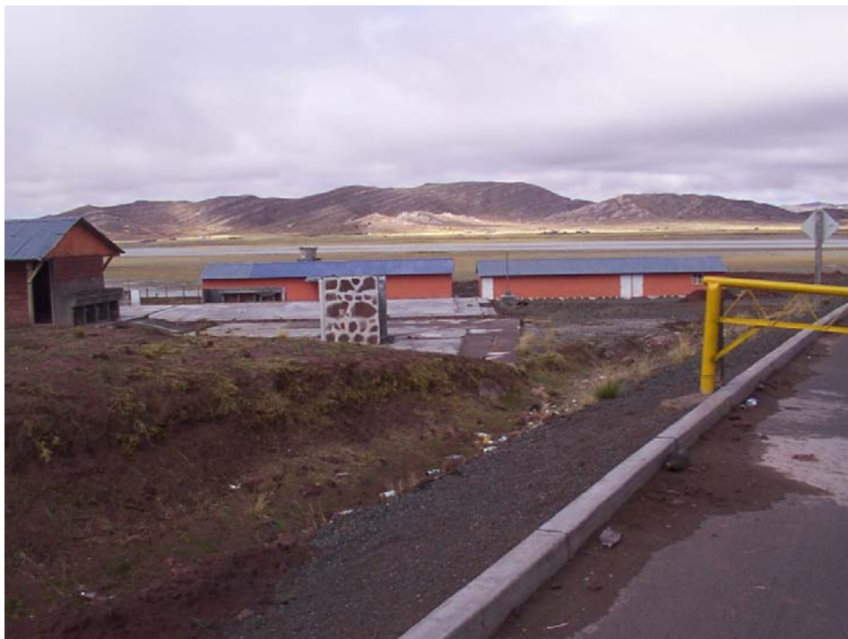
Instalaciones precarias de la aduana Boliviana a la vera del puente nuevo