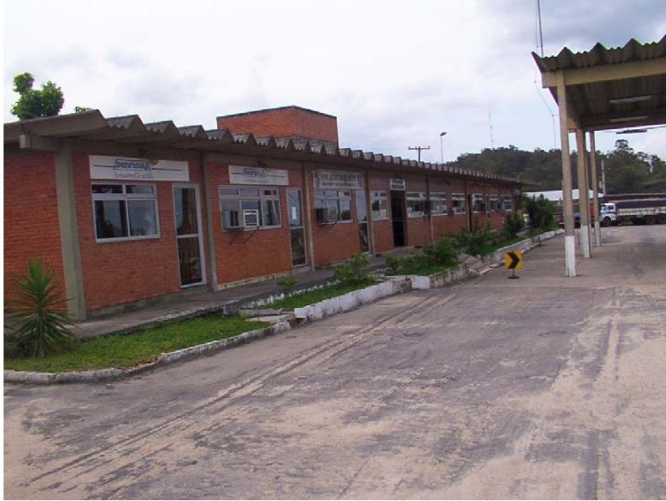
Sector de Oficinas Uruguayas y del concesionario en el ACI