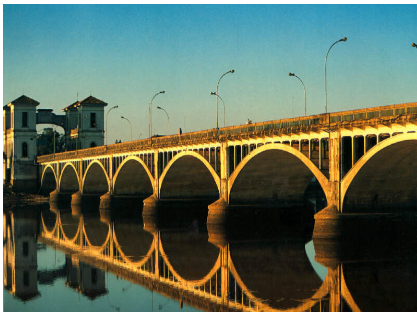
Puente Internacional Río Branco - Jaguarao