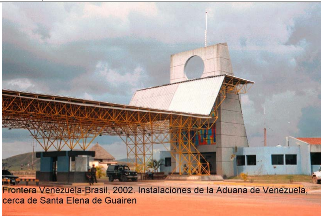
Frontera Venezuela-Brasil, 2002. Instalaciones de la Aduana de Venezuela, cerca de Santa Elena de Guairén