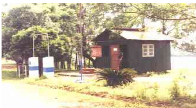
Colonia Aurora - Pratos