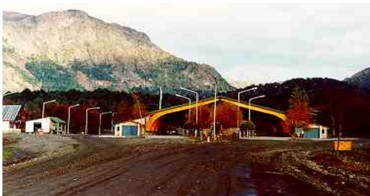
Vista del paso Cardenal Samoré