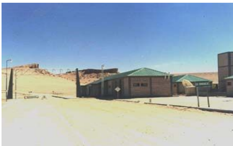
Paso de Sico – Lado Argentino