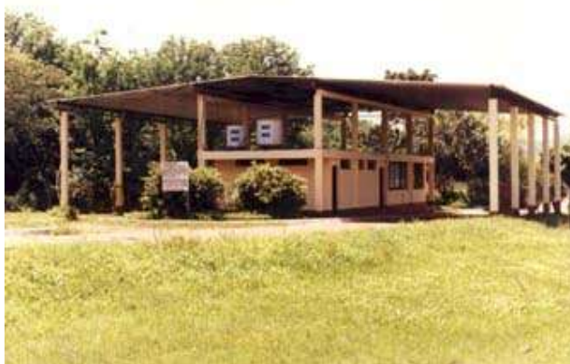
Panambi – Veracruz – Instalaciones Argentinas