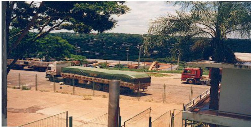
Vista parcial del recinto aduanero paraguayo