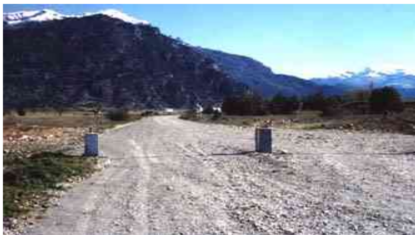
Paso Río Futaleufú – Argentina