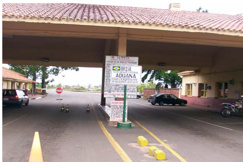
Área de control de pasajeros – Cabecera argentina