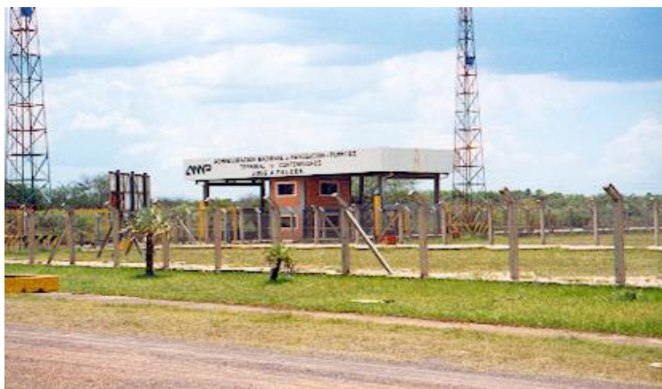
Terminal Chaco-Y – Puerto Falcón – Paraguay