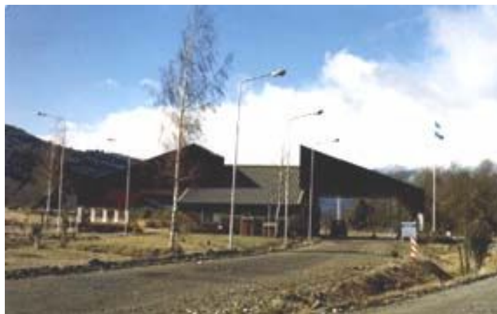
Paso Hua Hum, - Argentina