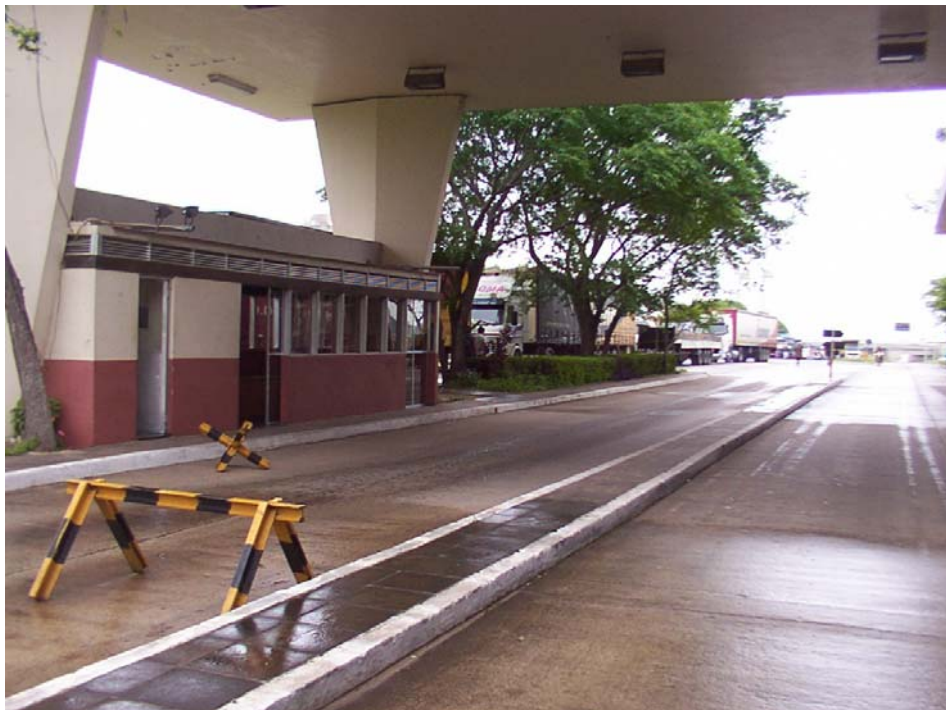
Instalaciones de control en BR 290