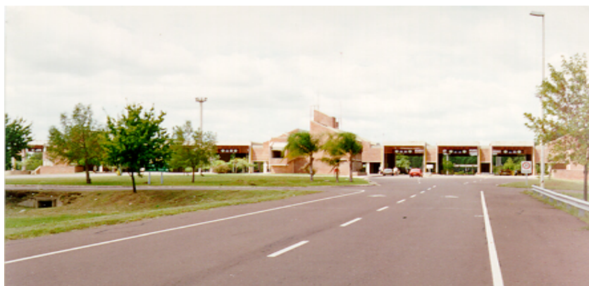
Vista del paso de frontera Concordia - Salto