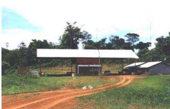
Pepirí Guazu – Sao Miguel