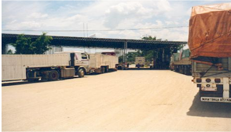
Clorinda – Pto. Falcón: Vista parcial del recinto aduanero argentino