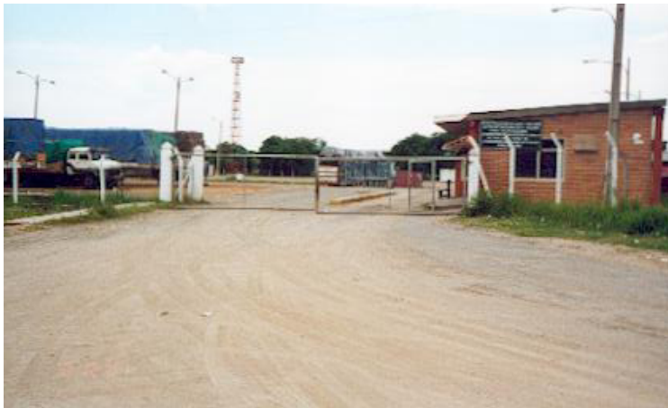
Acceso al recinto de Paraguay