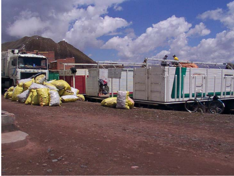
Camiones cargando los productos que cruzaron el puente internacional en triciclos