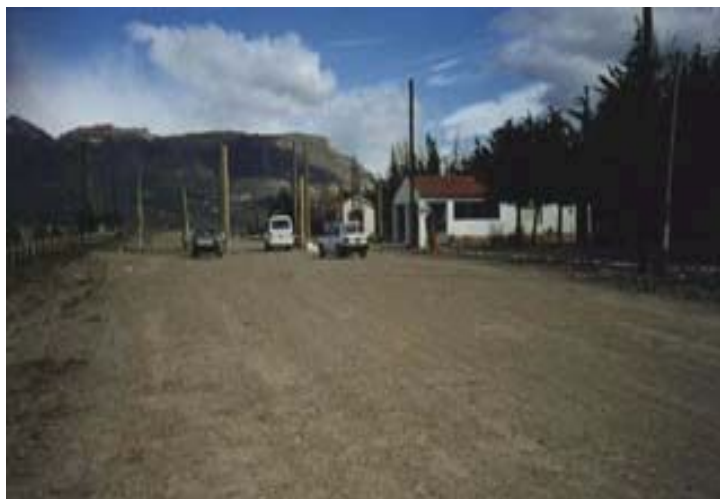
Paso Rio Jeinemeni – “Chile Chico” - Argentina