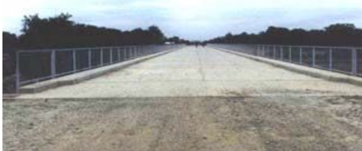
Paso Misión La Paz – Pozo Hondo