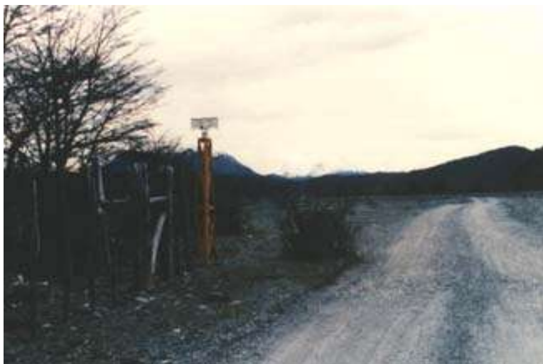
Paso Río Mosco – Argentina