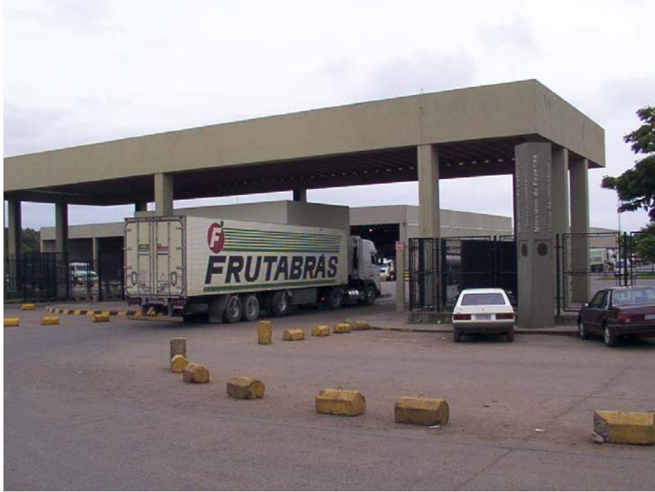
Portón de salida EADI – Uruguayana