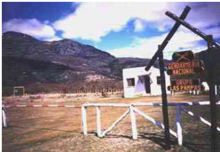
Paso Las Pampas – Lago Verde – Lado Argentino