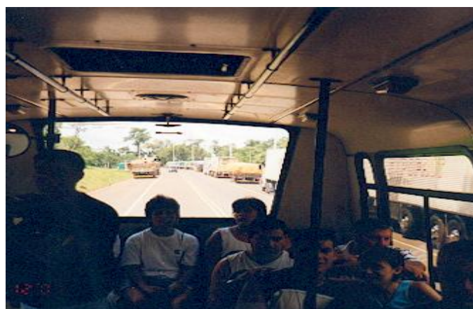
Vista de los camiones que ingresan de Brasil estacionados sobre la Ruta al aguardo de ingresar al recinto argentino