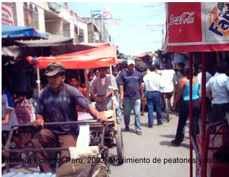
Frontera Ecuador-Peru, 2002. Movimiento de peatones y triciclo