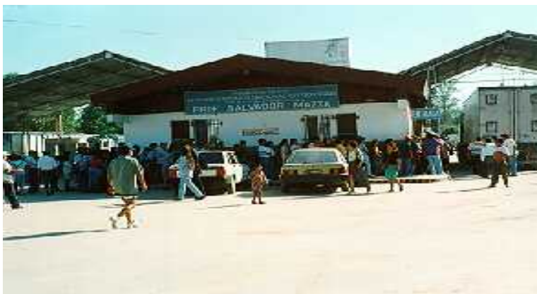
Vista del paso Salvador Mazza – Yacuiba