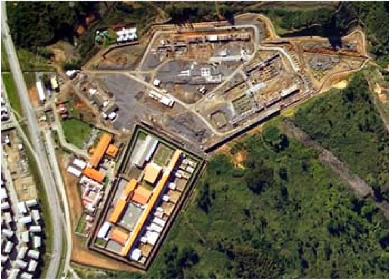
Centro Penitenciario Rancagua

Además, somos parte de la modernización del sistema penitenciario de Chile