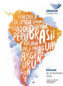
Informe de Actividades del COSIPLAN 2016

Como todos los años, los informes correspondientes a la Cartera de Proyectos y a la API presentan el estado de avance de los proyectos de integración e incorporan análisis agregados de las principales variables de estos portafolios.