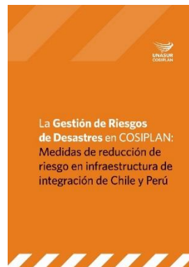
La Gestión de Riesgos de Desastres en COSIPLAN: Medidas de reducción de riesgo en infraestructura de integración de Chile y Perú

Los mismos se encuentran disponibles en versión digital en el sitio web del COSIPLAN, se enviarán copias físicas a Chile y Perú y a los países que así lo requieran. Los informes se adjuntan como Anexos 6 y 7.