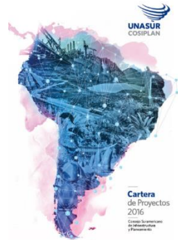
Cartera de Proyectos del COSIPLAN 2016

La Secretaría del CCT informó que ya se encuentran publicados los siguientes informes: