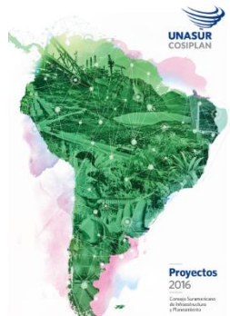
Fichas de los Proyectos del COSIPLAN 2016