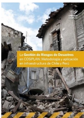
La Gestión de Riesgos de Desastres en COSIPLAN: Metodología y aplicación en infraestructura de Chile y Perú

La Secretaría del CCT informó que ya se encuentran publicados los siguientes informes: