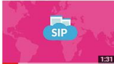
Sistema de Información de Proyectos del COSIPLAN

La Secretaría del CCT informó que ya se encuentra publicado en el sitio web del COSIPLAN un video que presenta el objetivo y funcionalidades de esta plataforma tecnológica. El enlace al video se presenta como Anexo 3.