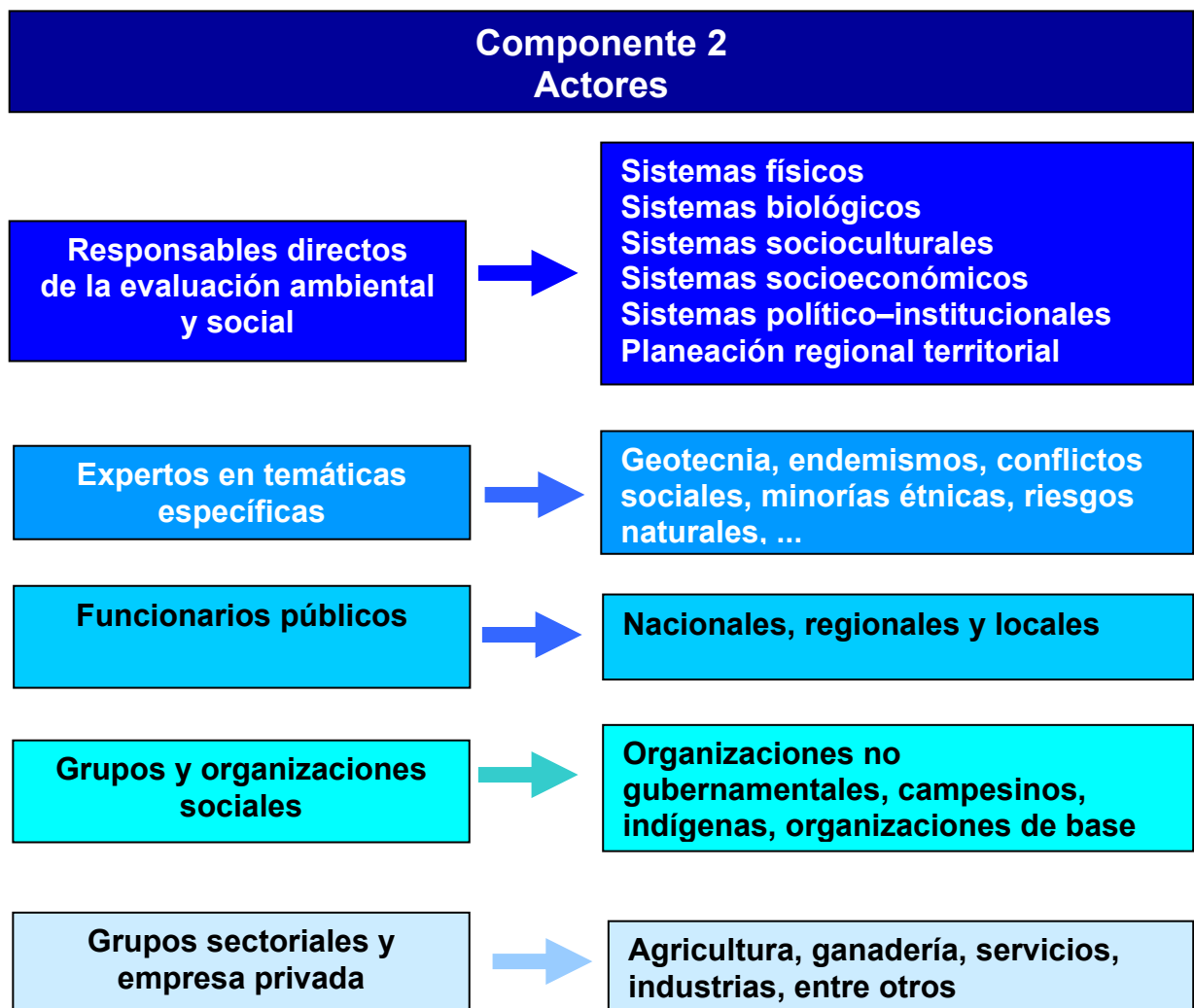
Figura 2. Grupos de Actores