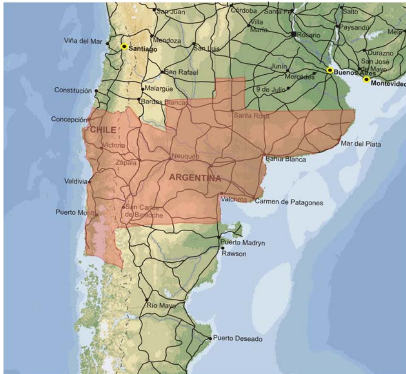
Mapa N° 35 – Ubicación y área de influencia del Eje del Sur

Si bien el territorio por donde se desarrolla el Eje abarca tres partidos (o departamentos) del sudeste de la provincia de Buenos Aires (Bahía Blanca, Villarino y Patagones), son las provincias de Río Negro y Neuquén, en Argentina, y las regiones VII, VIII, IX y X en Chile (regiones del Maule, del Bío Bío, de la Araucanía y de Los Lagos, respectivamente), las que más relacionadas se encuentran con el mismo.